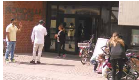
Willkommenscafé im Roncalli Haus

Der zweite wichtige Baustein im Café ist das persönliche Gespräch. Die Flüchtlinge berichten über ihre Flucht und zeigen in Atlanten den Fluchtweg