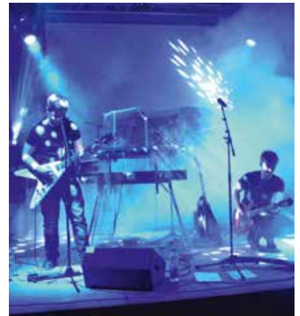
Benefizfestival in Querum – fünf Bands spielten für die Flüchtlingshilfe