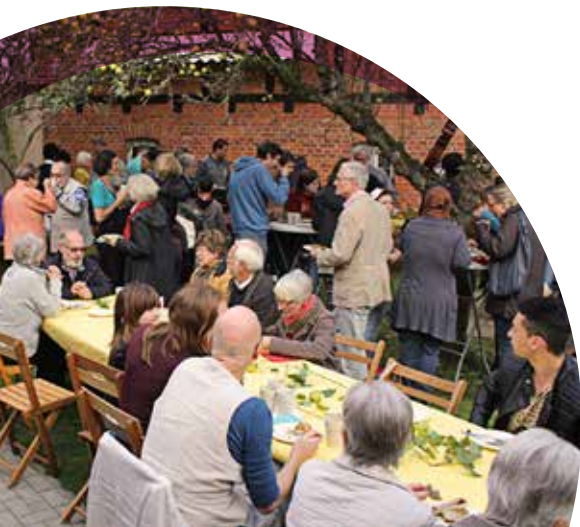
Matinee im Kino Bad Gandersheim

Mittlerweile leben ca. 200 Flüchtlinge in Bad Gandersheim. Hinzu kommen Flüchtlinge, die über die Außenstelle der Erstaufnahmeeinrichtung in Friedland im ehemaligen Hotel Bartels untergebracht sind. Ende 2015 lebten dort bis zu 500 Personen.