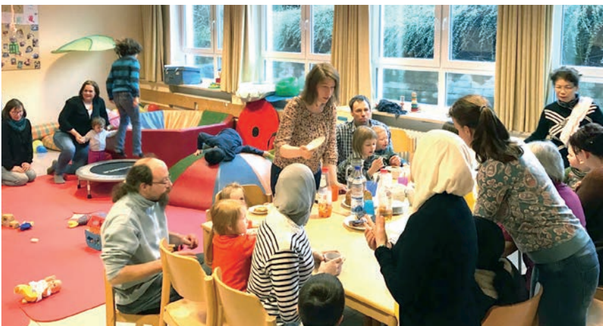
Bunter Familiennachmittag mit Kindern jeden Alters