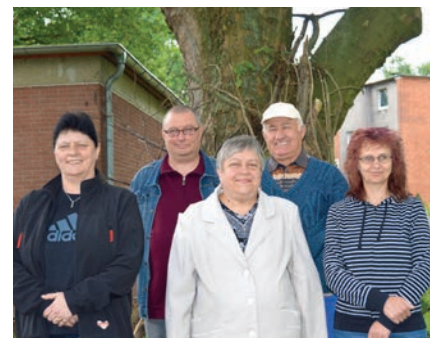
Mitarbeitende im Programm Soziale Teilhabe

spruch. Die Verunsicherung durch die lange Abwesenheit aus dem Berufsleben wird zunehmend geringer und das Selbstbewusstsein steigt. Die Erfahrung der letzten Jahre in den diakonischen Angeboten hat gezeigt, dass die Teilnehmer/innen zunächst einfache Tätigkeiten bewältigen. Anschließend trauen sie sich zu, je nach eigenen Fähigkeiten auch einmal mit Unterstützung kleine zusätzliche Projekte zu übernehmen, wie z. B. eine Kreativgruppe, die malt oder bastelt.