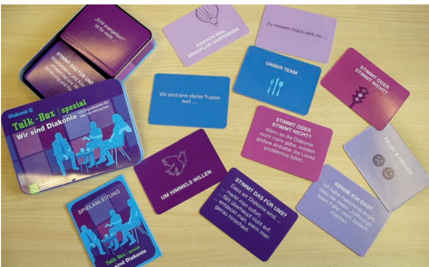
Leitbildtag 17. Mai 2018 im Theologischen Zentrum, Braunschweig

Alltag der Welt. Als soziale Arbeit der evangelischen Kirchen hat die Diakonie hier ihren Ort und damit wesentlichen Anteil an der Lebendigkeit von Kirche.