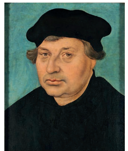
Der Reformator Johannes Bugenhagen

Und 500 Jahre später? Da ist es selbstverständlich geworden, von „Diakonie als zentraler Lebens- und Wesensäußerung der evangelischen Kirchen“ zu sprechen, so in der Grundordnung der EKD. Wer danach fragt, was Kirche lebendig macht, stößt also grundlegend auf den Zusammenhang von Wort und Tat und damit auf den Gottesdienst im