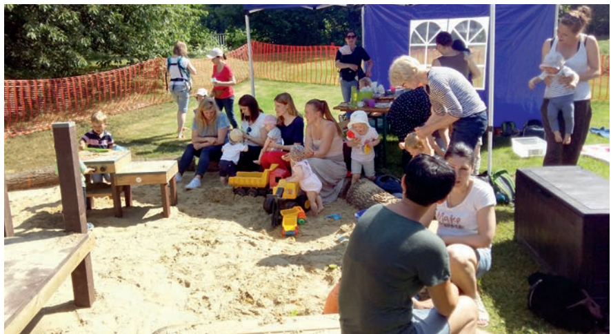
Einweihung des „Fischerteiches“ auf dem Außengelände, Haus der Kirche, 28. Mai 2018

Wie alles begann: Im Januar 2014 wird in einer ersten Kooperation der Kirchengemeinde und der Kreisstelle das Projekt KiWi – Kinder Willkommen initiiert. Vorangegangen war der Beschluss der Kirchengemeinde, junge Familien stärker in den Blick zu nehmen.