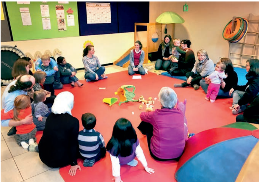
Begrüßungskreis KiWi International

Diakonie und der ländlichen Erwachsenenbildung wird geschlossen. Das Ergebnis: Ein Sprachkurs für geflüchtete Frauen mit kleinen Kindern – dreimal die Woche, vormittags, Kinderbetreuung inklusive.