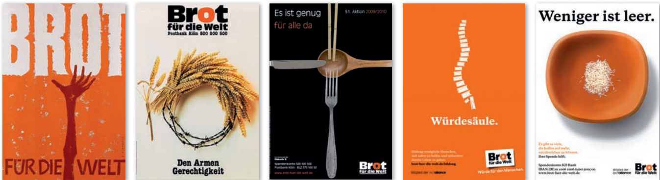
Plakate aus 60 Jahren Brot für die Welt

men und gute Lebensbedingungen ermöglichen, ABER die Ressourcen sind nicht gleichmäßig verteilt. Die Menschen im Norden leben im Überfluss, die im Süden im Mangel. Teilen, Abgeben und Verzichten sind die Tugenden, die zu einem Ausgleich führen können. Jeder Euro, den wir abgeben und spenden, aller Einsatz im Haupt- und Ehrenamt hilft bei der Beseitigung der ungerechten Verteilung.