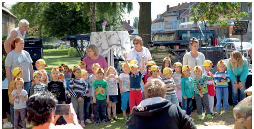
Zur Eröffnung des Start.Punkt.SZ am 23. August 2017 sangen Kinder aus dem Martin-Luther-Kindergarten.

Die enge Zusammenarbeit von Kirche und Diakonie begann mit den Planungen für den Aufbau des Generationentreffs in der Martin-Luther-Straße 22, mit Blickkontakt zur Kirche. Aus einem Mittagstisch heraus, der von der Kindergartenküche der Martin-Luther Gemeinde mit unterhalten wurde, rekrutierten sich die ersten Besucher des Treffs. Es handelte sich um überwiegend alleinstehende Senioren, die den Treff dankbar annahmen. Dort wurden verschiedene Aktivitäten und gemeinschaftliche Angebote unterbreitet und konnte so Geselligkeit erlebt werden. Darüber hinaus erhielten die Besucher im Treff Hilfe und Unterstützung bei Fragen zu altersgerechtem und selbstbestimmtem Wohnen und durch Vermittlung niedrigschwelliger Hilfen. Durch den ständigen Austausch mit Pfarrer Wagner und seiner Kennt-